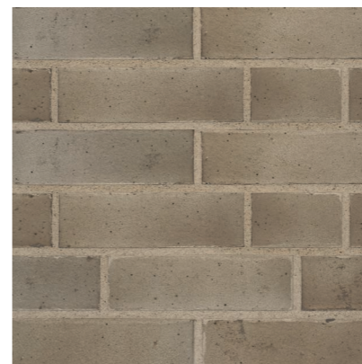
Rovigo 240 x 115 x 71 mm

Hier sehen Sie insgesamt fünf Farbvarianten der Recyclingklinker mit Sägeschlamm als Sekundärrohstoff. Wie bei all unseren Produkten können individuelle Farben und Formate auf Kundenwunsch hergestellt werden.