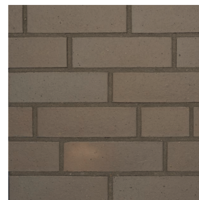
Recco 240 x 115 x 71 mm