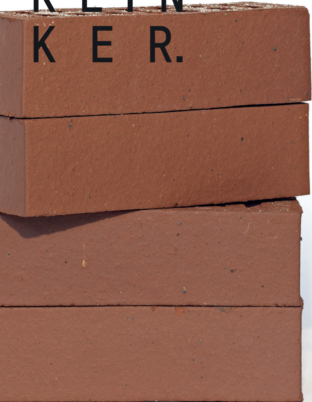
Ribera 240 x 115 x 71 mm