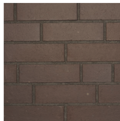
Rovato 240 x 115 x 71 mm