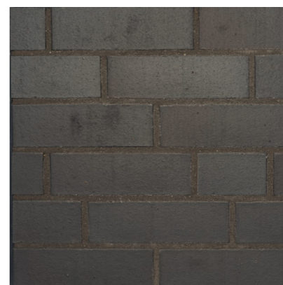
Rezzato 240 x 115 x 71 mm